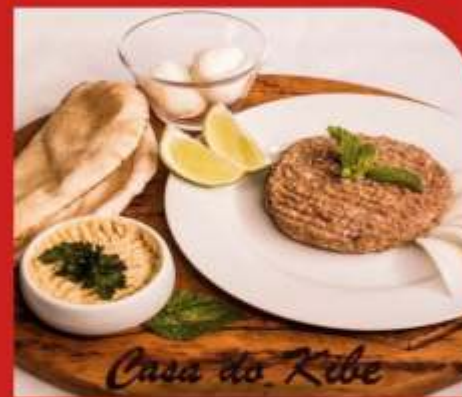
Hibe Cru / Coalhada Seca