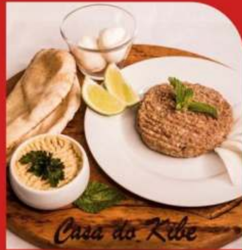
Kibe Cru / Coalhada Seca