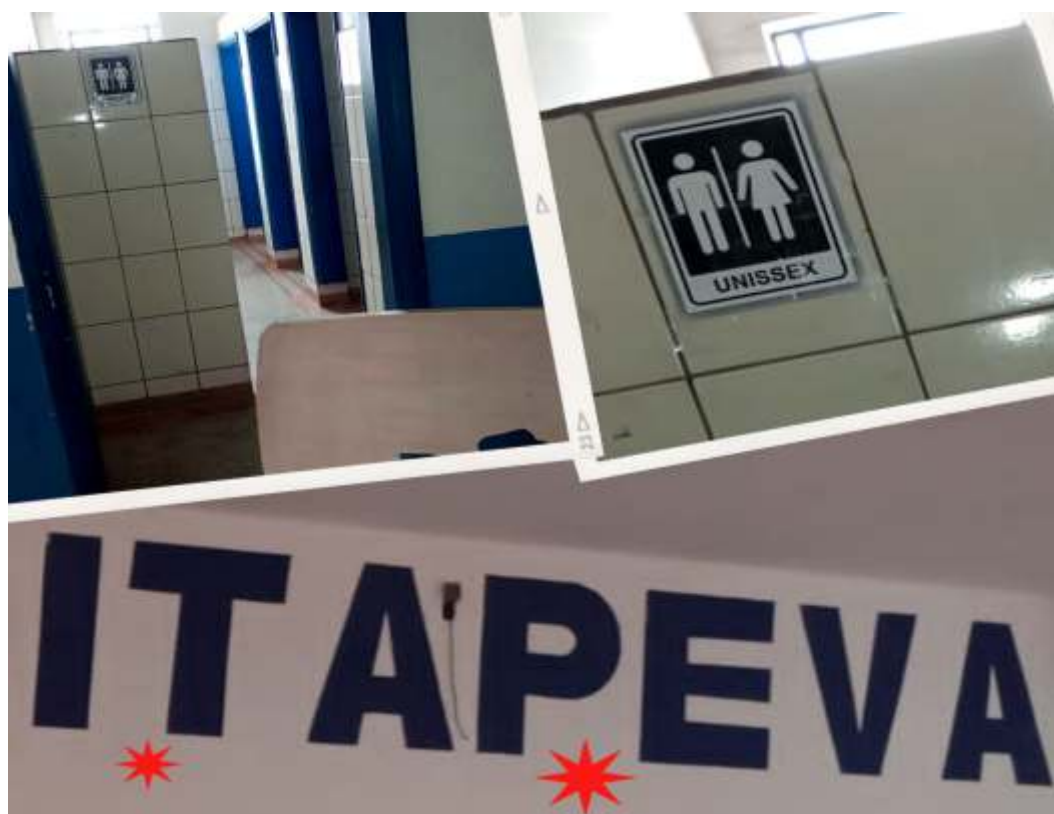
Imagem repercutiu rapidamente e secretários da Defesa Social, Esporte e comandante da GCM foram verificar o local.

Na manhã desta quinta-feira (15), uma imagem compartilhada no WhatsApp gerou revolta de munícipes em Itapeva.