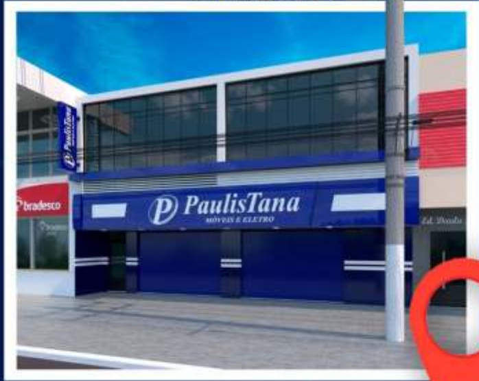
Praça Anchieta, 156 - Centro

Você sabia que estamos com uma NOVA LOJA em Itapeva-SP?